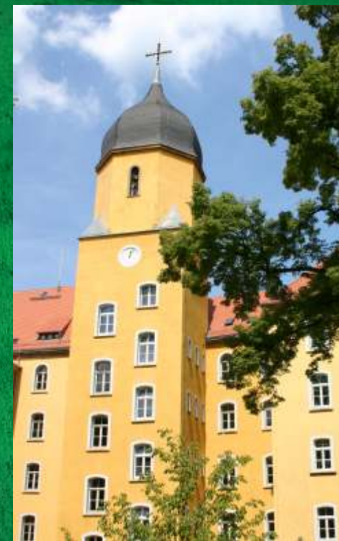
Ehemals Königliche Erziehungs- und Bildungsanstalten Droyßig

Teilprofil Wirtschaft Hochbegeabtenförderung